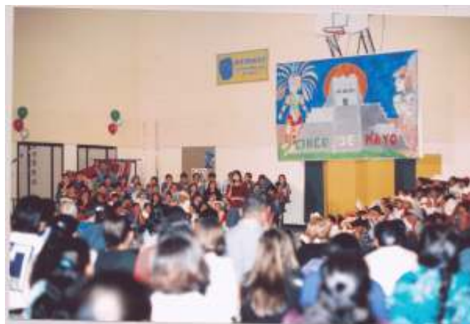
Estudiantes de la escuela Murphy en la celebración del Cinco de Mayo.