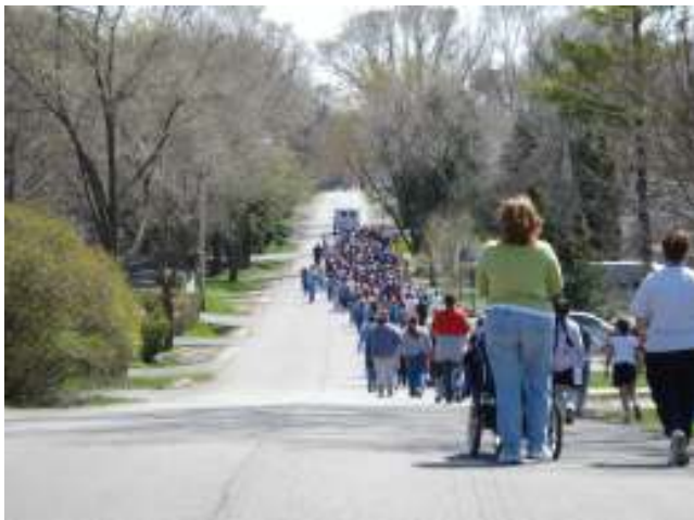
Caminata de toda la escuela "Walk for Diabetes"