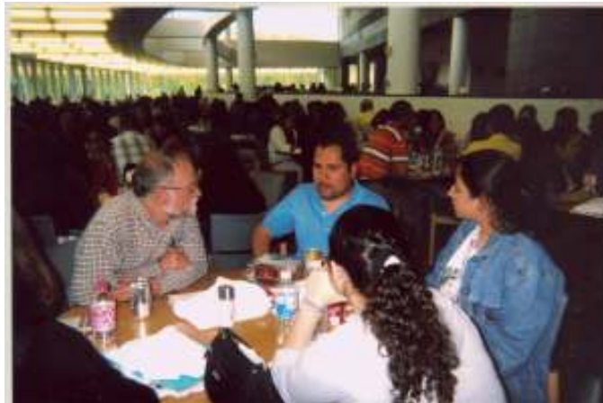
Maestros, trabajadores de Grainger y estudiantes discuten carreras futuras.

Las próximas diez y media semanas pueden ser una oportunidad maravillosa para continuar el aprendizaje de su hijo en cualquier ambiente en que se encuentre. Si usted hace el aprendizaje significativo (si conecta una experiencia anterior a lo que está aprendiendo) su hijo retendrá mejor la información nueva. Practicando las habilidades de lectura de su hijo en cualquier idioma su hijo estará listo para empezar la escuela con más confianza. ¡Que tengan todos un verano feliz!