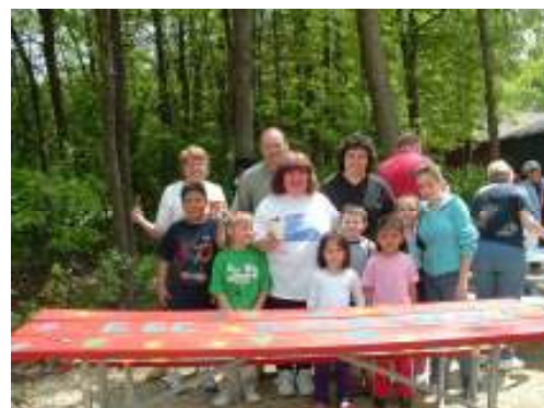
Character Counts! Pintando mesas del picnic en la Ceremonia de Premios el Año Pasado.

CHARACTER COUNTS! También quiere dar las gracias a Round Lake Beach por apoyarlo. Round Lake Beach acaba de pintar su nueva torre de agua con las palabras "A Character Counts! Community". Qué manera maravillosa de reforzar que somos personas de carácter en el Area de Round Lake.